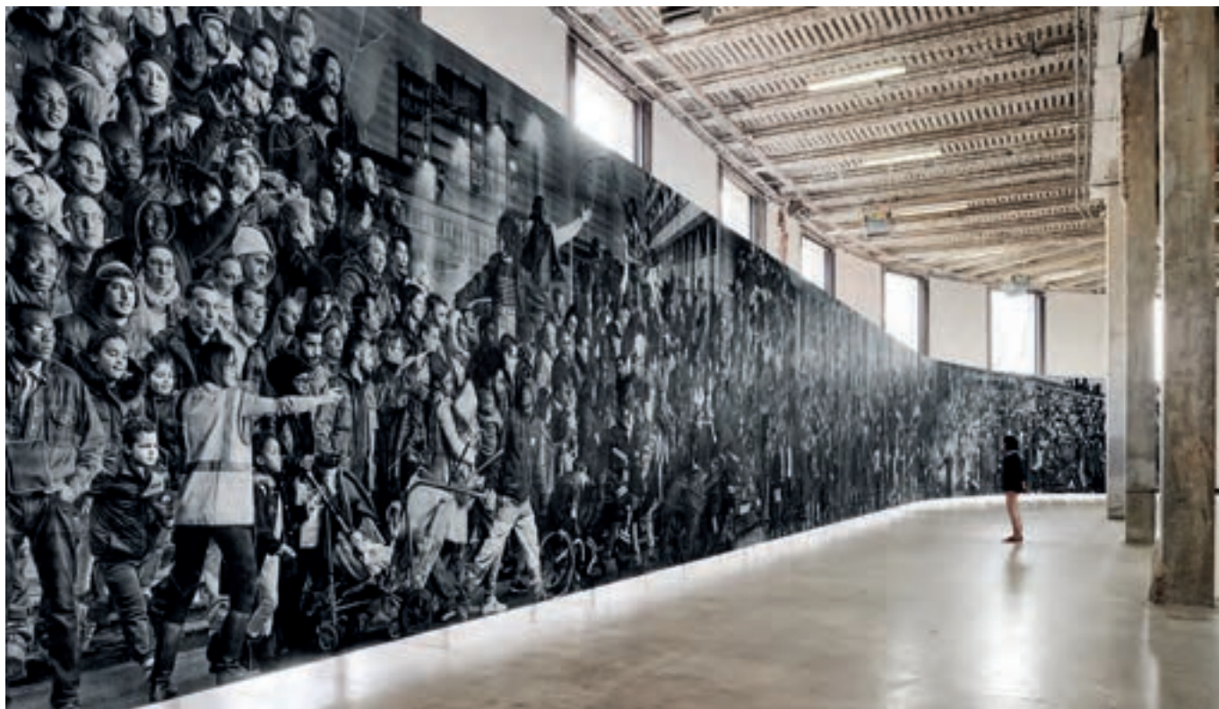
JR, Chroniques de Clichy-Montfermeil , 2017. Vue de l'installation au Palais de Tokyo, avril 2017. Photo : Fabien Barrau. © ADAGP