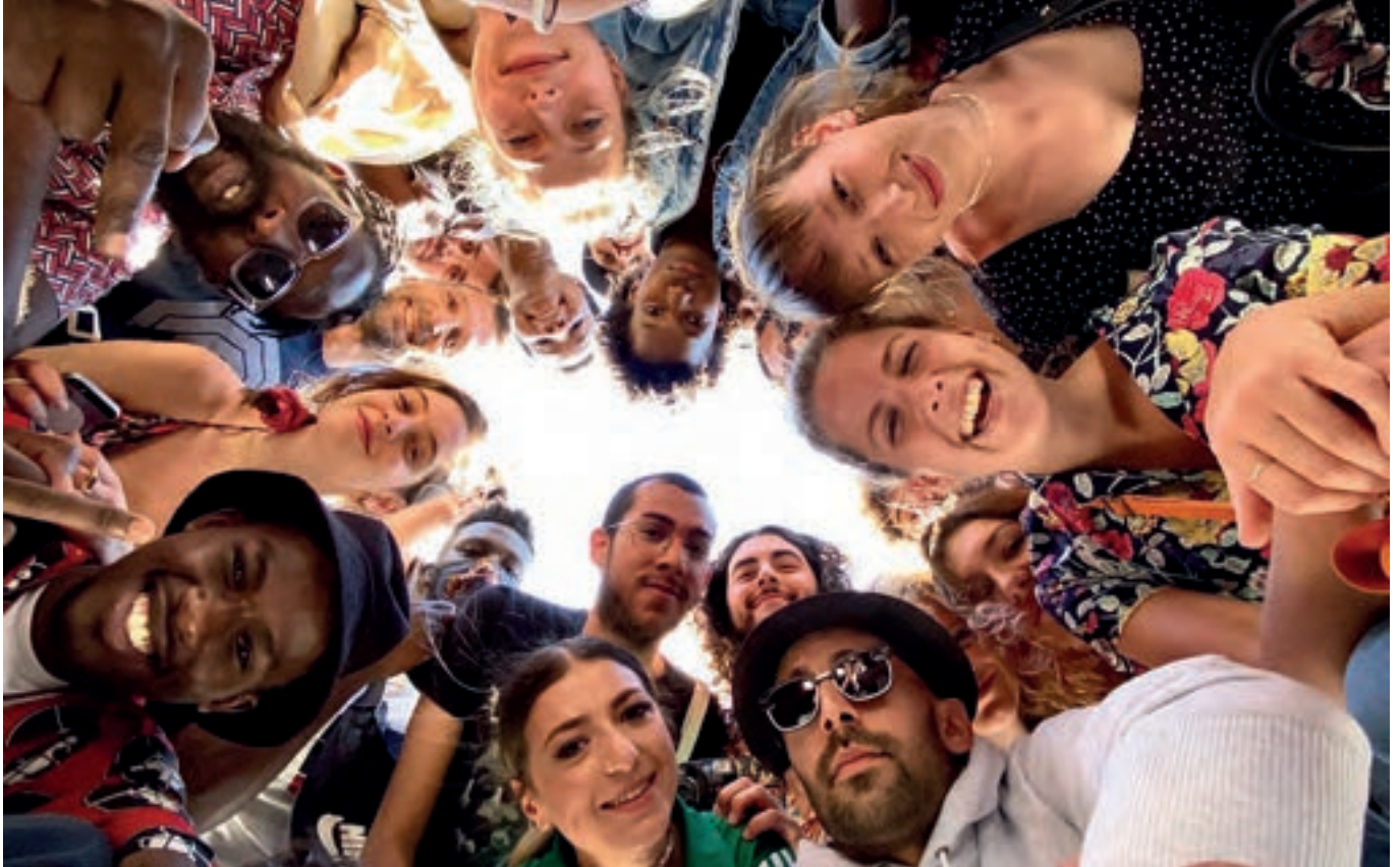
L'école Kourtrajmé.

« Kourtrajmé, c'est une bande de potes qui viennent de différents milieux sociaux. On se connaît tous depuis qu'on a 10 ans. C'est après avoir vu le film « La Haine » de Mathieu Kassovitz qu'on a décidé de monter le collectif. Les gens pensent que Kourtrajmé était une grosse boîte de production avec des moyens incroyables alors que non, on était une dizaine avec deux petites caméras numériques toutes pourries. On avait pas de moyens, c'était surtout de la volonté de faire des films. Pendant dix ans, c'était de la débrouillardise, on appelait des potes pour se faire prêter une caméra, un micro, on allait les récupérer à l'autre bout de Paris. On ne le faisait pas pour l'argent mais parce qu'on kiffait ce qu'on faisait. C'était ça notre force ! C'est quand on n'a pas de moyens qu'on arrive à sortir les meilleures choses. » Ladj Ly, entretien avec le Bondy Blog, mai 2019